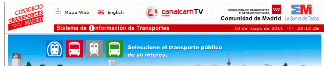
Consorcio de Transporte de Madrid