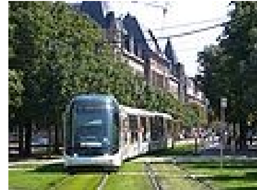
Proyecto de ciudad – Estrasburgo . Tomado de Internet