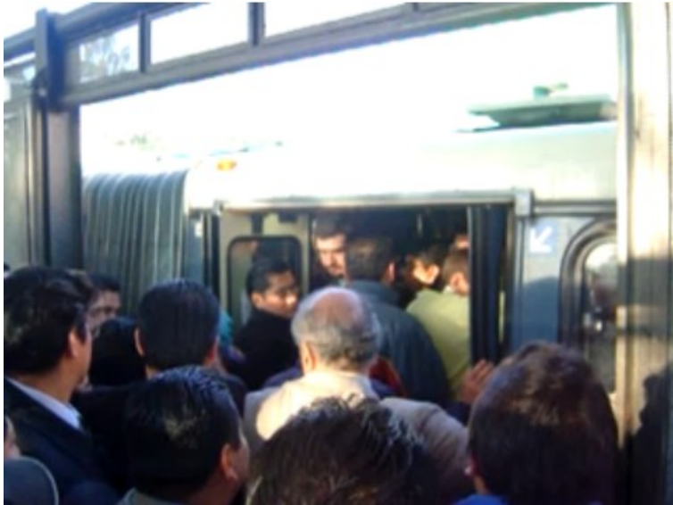
Estación de Metrobus México DF - youtube