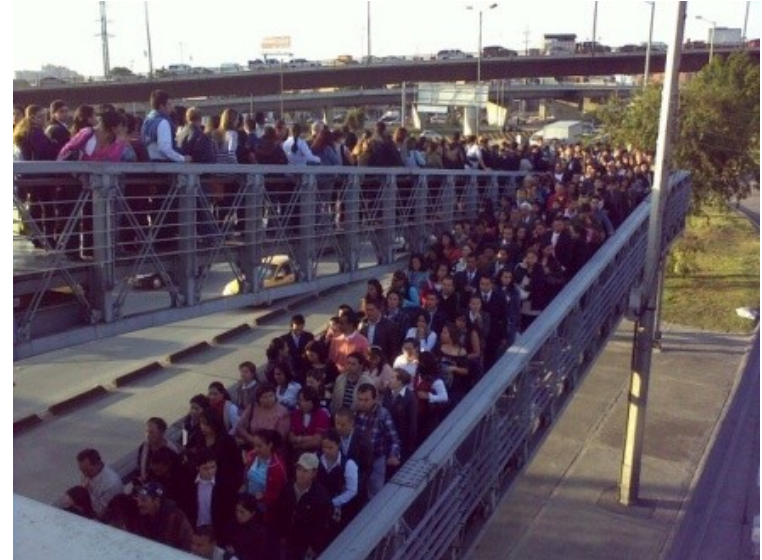
Estación Virrey TransMilenio . Internet

Y nuestra gente..... Descontenta Largas filas Estaciones llenas Buses llenos Largas caminatas Nivel de servicio deteriorado (carros de ruta)